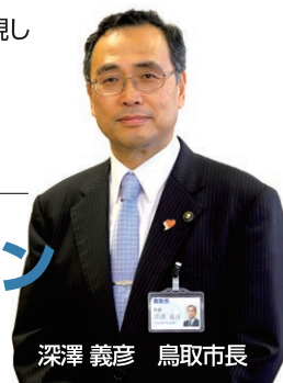
深澤 義彦 鳥取市長